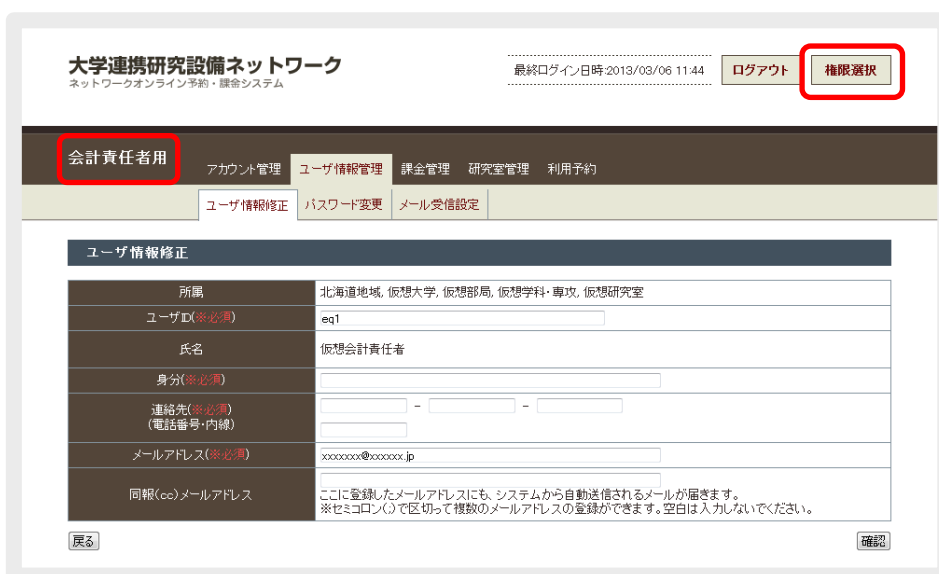
図0.3 左上：作業中の権限表示 右上：権限選択画面へのリンク

※ 現在どの権限で操作しているかは、メニュー左上に表示されています。その他の権限へ移行したい場合は、メニュー右上の[権限選択]をクリックして権限選択画面へ戻り、移行したい権限を選択してください。