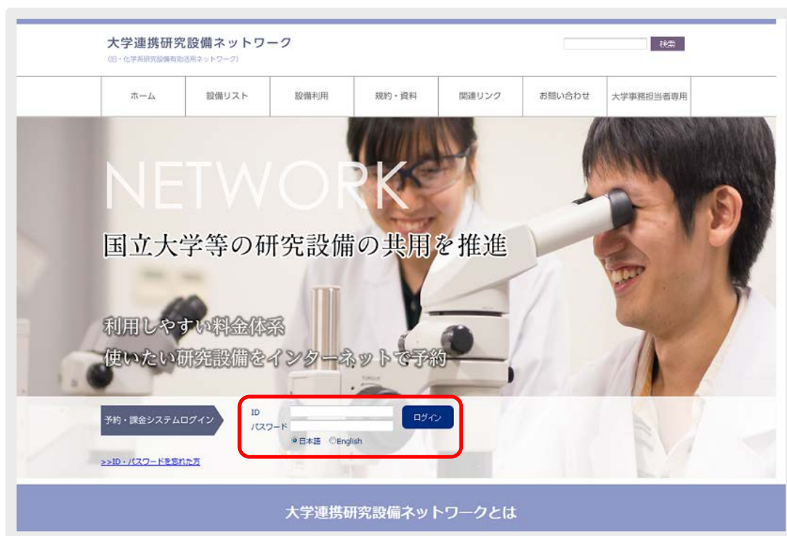
図0. 1 ログイン窓